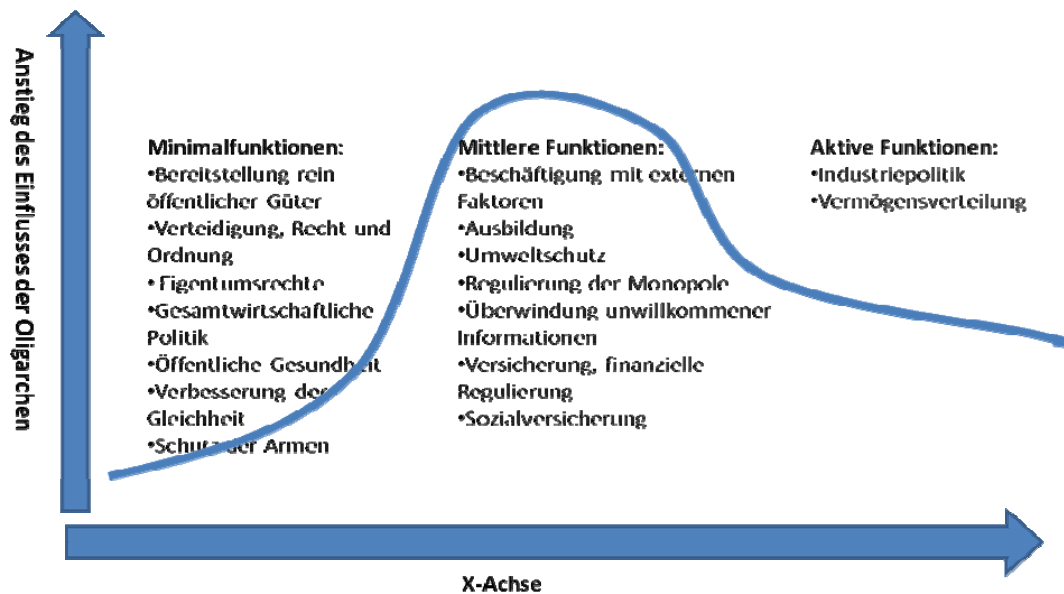
Abbildung 6: Der Einfluss der Oligarchen bei der Bandbreite staatlicher Funktionen Nach: Fukuyama, Francis: Staaten bauen. (2006, Ullstein Verlag)