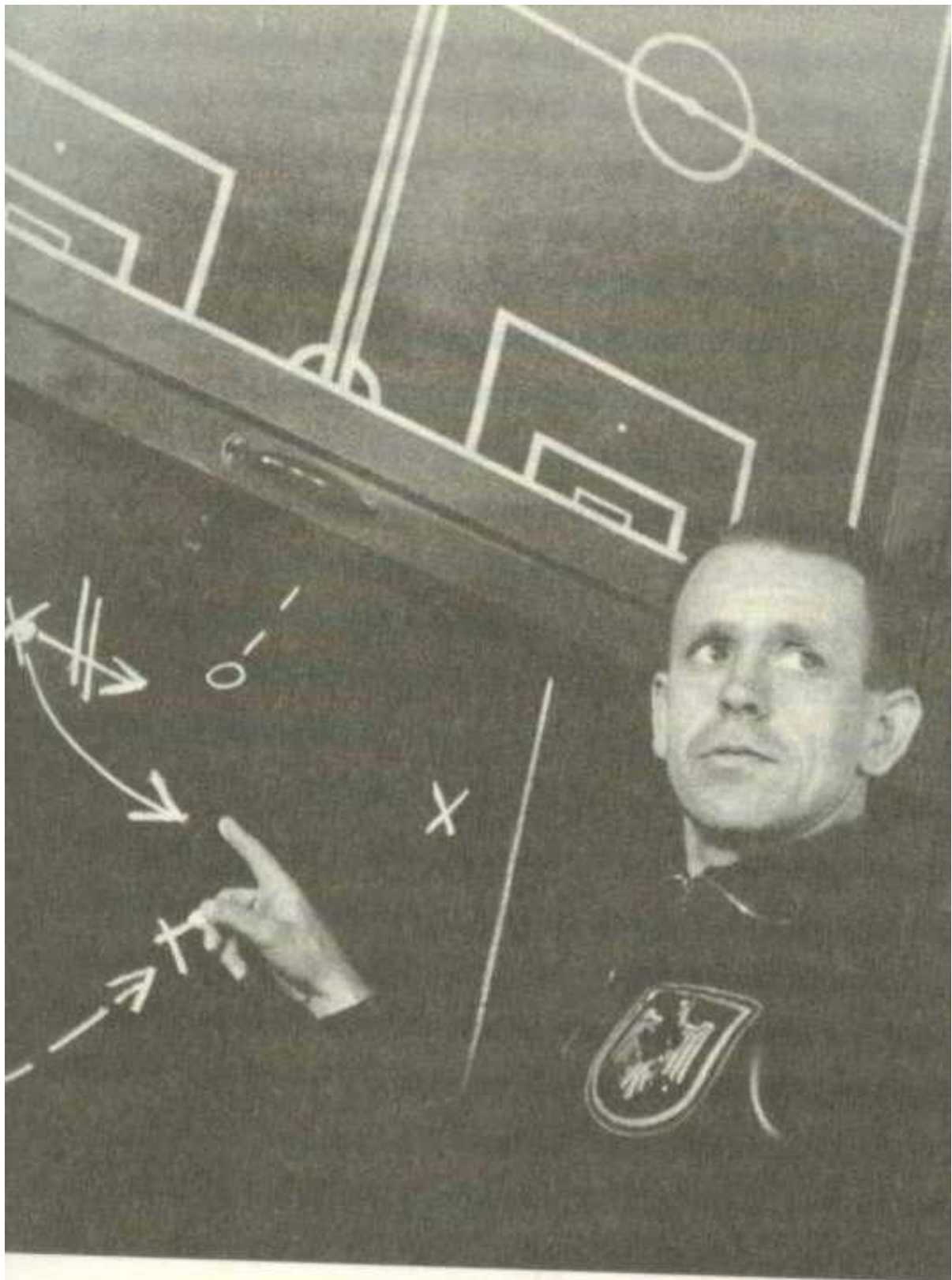
»Parteilpolitisch waren die im Fußballsport führenden Männer nicht gebunden« – Reichstrainer Sepp Herberger 1938.